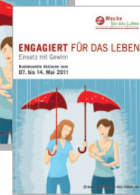
Motivplakat DIN A4