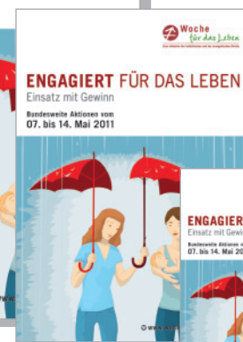
Motivplakat DIN A3