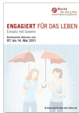
Ankündigungsplakat DIN A3