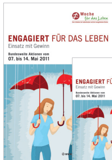
Motivplakat DIN A1

Materialien bestellen, downloaden, lesen: www.woche-fuer-das-leben.de