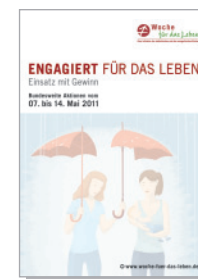
Ankündigungsplakat DIN A4